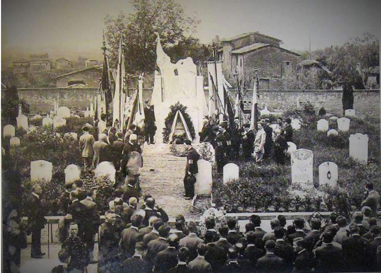
Fig. 5: Inaugurazione del monumento ai caduti della Prima Guerra Mondiale, 2 novembre 1920

Il monumento venne inaugurato solennemente il 2 novembre 1920 e fu collocato al centro del quadrato monumentale nel quale furono sepolti i soldati combattenti nella Prima Guerra Mondiale ricoverati a seguito di malattie e ferite nell'ospedale militare di Siena e qui deceduti, quasi a simboleggiare il cameratismo del tempo di guerra e l'uguaglianza dei caduti di fronte alla morte.