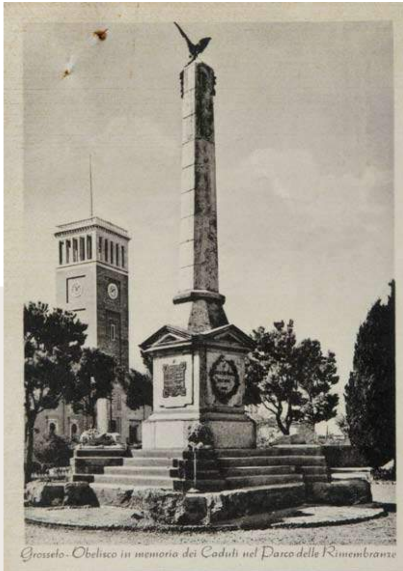
Grosseto - Obelisco in memoria dei Caduti nel Parco delle Rimembranze