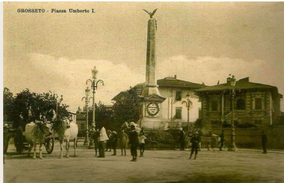
Fig. 8: I. e G. Luciani, Monumento ai caduti della Guerra d'Indipendenza, 1896, Grosseto (AS GR)

Il monumento civico di Grosseto dedicato ai caduti della Grande Guerra è da considerarsi il Monumento al Milite Ignoto, progettato dagli ingeneri Ippolito e Giuseppe Luciani, su commissione della Società dei Reduci delle Patrie Battaglie, dedicato originariamente ai caduti democratici del 1849-70 e collocato in piazza Umberto I (oggi piazza Fratelli Rosselli) e fu inaugurato nel 1896.