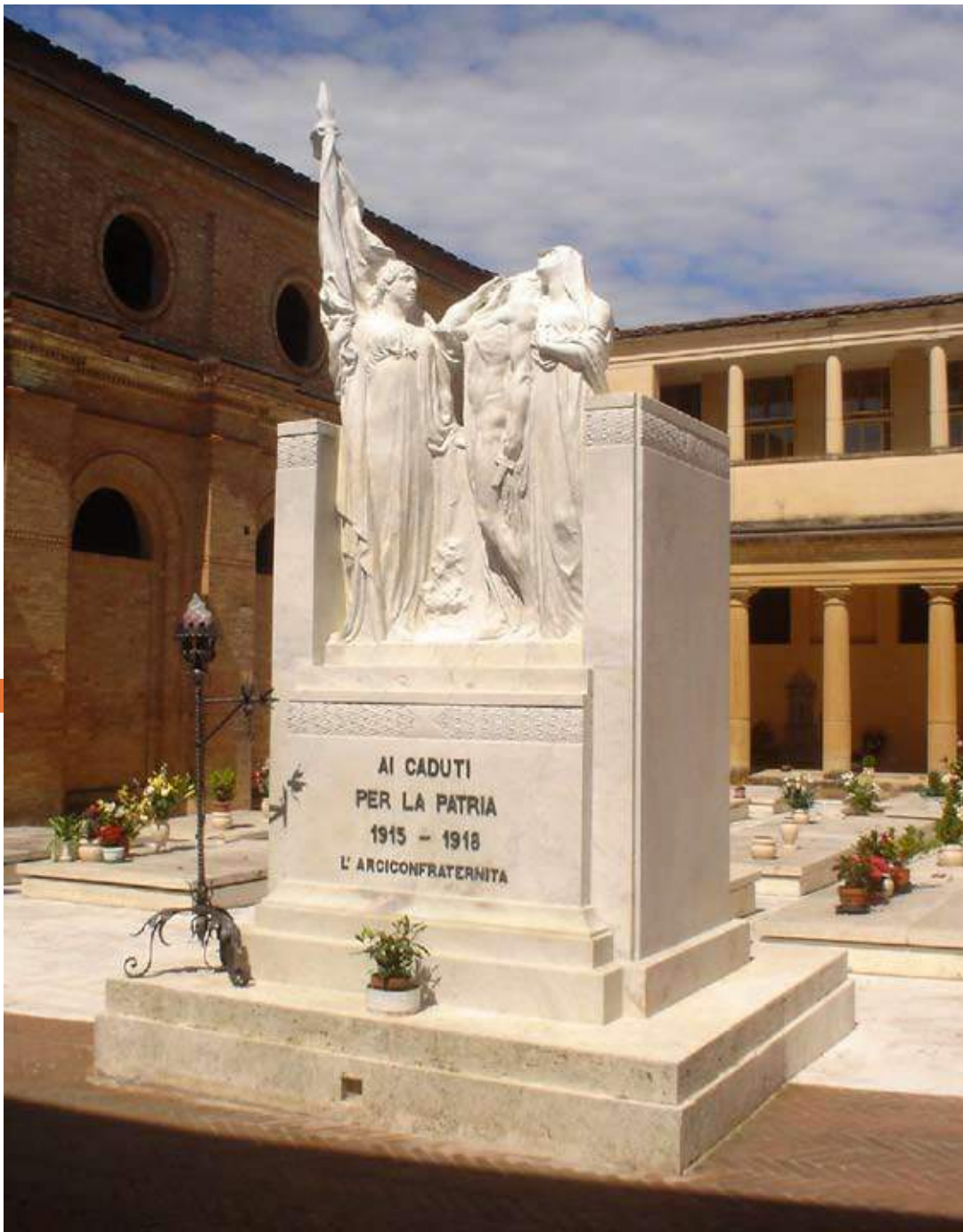
Fig. 6: G.G. Bianconi, Monumento ai caduti nella nuova collocazione moderna, Cimitero della Misericordia, Siena (AS della Misericordia, Siena)

L'opera poi nel 2007 venne dislocata, a seguito di uno smantellamento dell'area dedicata, in una posizione più defilata, in una zona adiacente all'area degli ex Acattolici, precedentemente riqualificata, dove era stato realizzato un sacrario e per il quale era stato progettato e mai realizzato, un nuovo monumento ai caduti, commissionato a Plinio Tammaro. 12