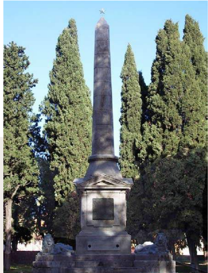
Fig. 9: I. e G. Luciani, Monumento ai Caduti, 1921 post, Bastione della Rimembranza, Grosseto (AS GR)