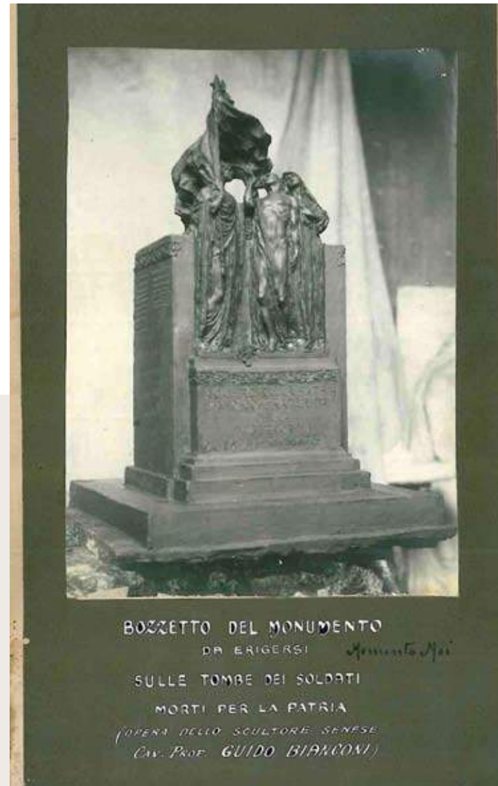
Fig. 3-4: G.G. Bianconi, Primo bozzetto per il monumento ai Caduti per la Patria, 1919 (collezione privata); G.G. Bianconi, Bozzetto approvato dalla commissione (AS della Misericordia, Siena)